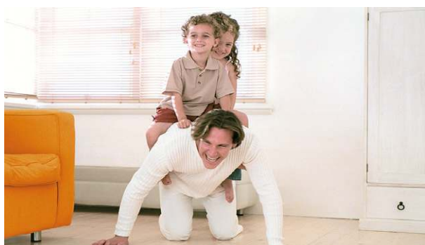
Защищает микроклимат в помещении естественным образом: Известковая штукатурка KIP и известковая шпаклевка KGN.

Экологический баланс известковых составов для внутренних работ полностью положительный. Они изготавливаются из высококачественного минерального сырья и состоят из природных добавок, таких как известняк, песок, мрамор и кварц. В качестве долговечного минерального вяжущего используется известь.