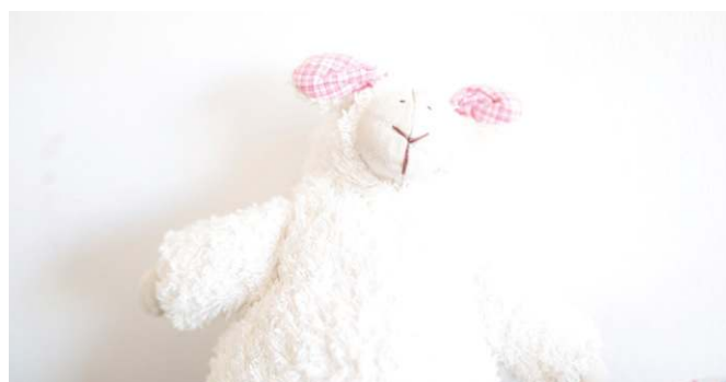
Чистая вещь: KIP и KGN регулируют влажность воздуха в помещении и препятствуют возникновению плесневых грибков.